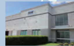
PILLAR America Inc.