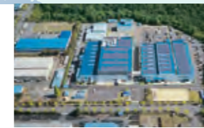
福知山事業所第1工場